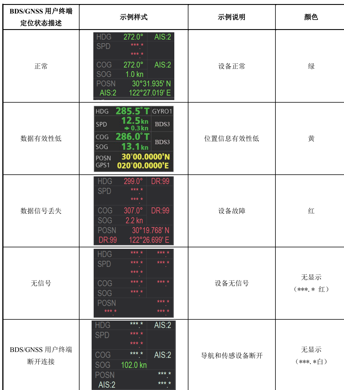
表 A.1 BDS-ECDIS 上 BDS/GNSS 用户终端信息符号

BDS/GNSS用户终端在BDS-ECDIS上显示的信息包括位置、航迹向、对地速度等，显示的颜色会随着BDS/GNSS用户终端数据来源的改变而改变。表A.1列举了可能存在的BDS/GNSS用户终端定位状态及对应的显示颜色，无BDS/GNSS用户终端数据接收时数据来源项显示为空。